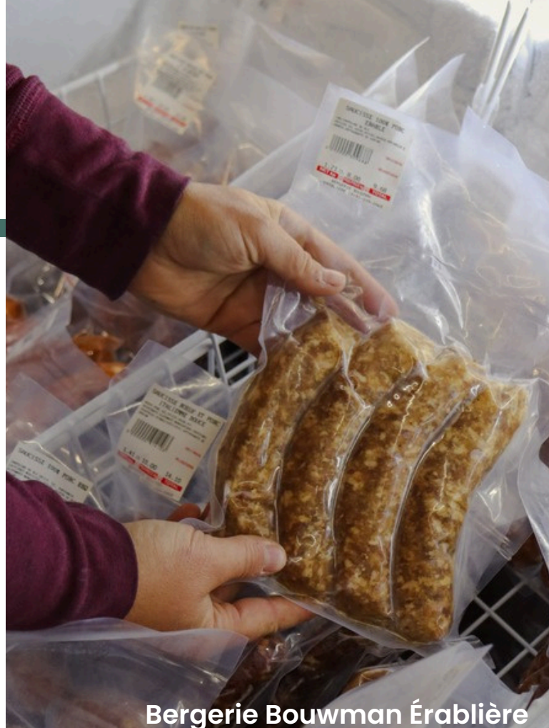
Bergerie Bouwman Érablière