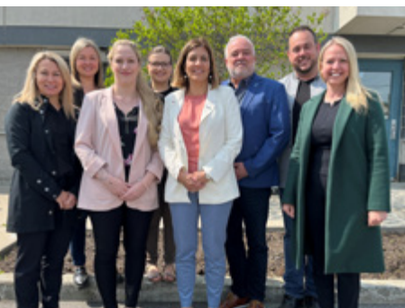
Photo prise en juin 2023, à l'occasion de l'inauguration du SGEE en communauté et en entreprise qui accueille des enfants dans des locaux de la Ville de Magog

* Site web : https://espacemuni.org/action-municipale/roles-des-municipalites